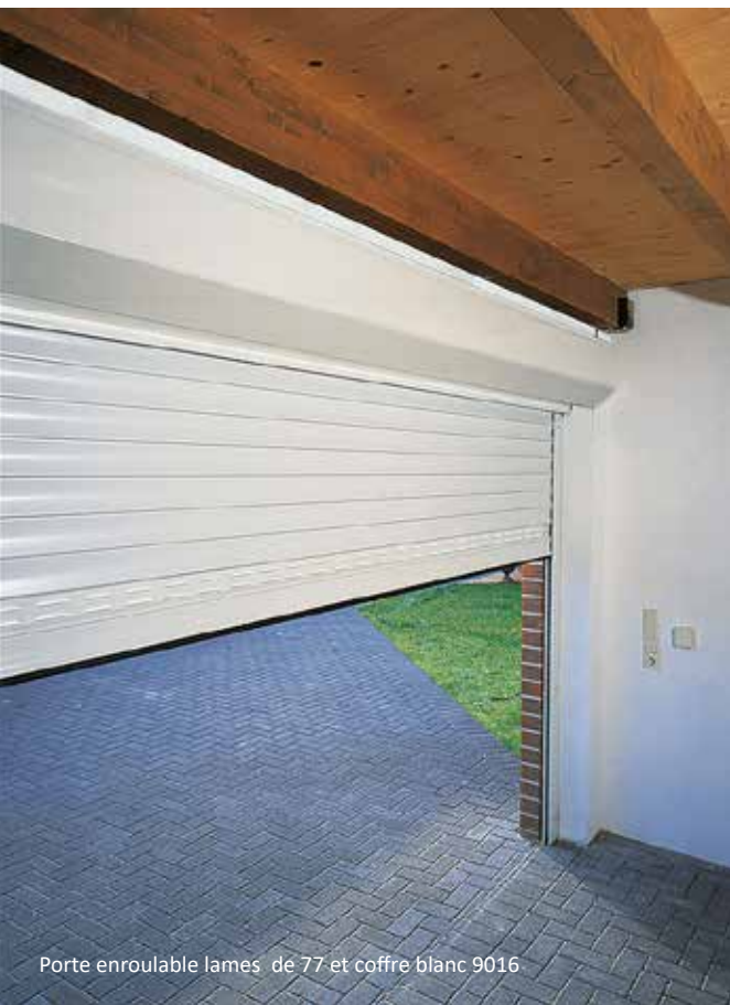
Porte enroulable lames de 77 et coffre blanc 9016

La porte de garage enroulable offre la solution adéquate en toutes circonstances. Elle se présente sous la forme d'un gros coffre de volet roulant qui se pose en applique intérieure sur le linteau.