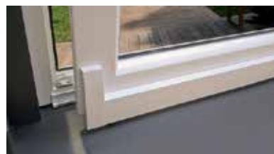
Renvoi automatique du vantail lors de la fermeture