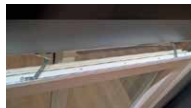
Double compas pour une sécurité maximale