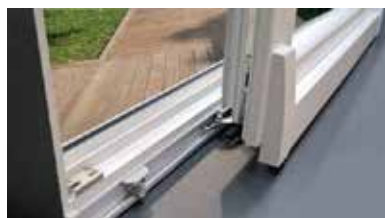
Roulements adaptés au poids du vitrage